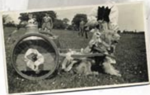
Ci Hufenfa Mount Pleasant yn cystadlu

Am nifer o flynyddoedd bu CRhA Ysgol y Waen yn trefnu'r Donkey Derby poblogaidd. Gŵr gwadd yr achlysur cyntaf yn 1975, a gyrhaeddodd mewn hofrennydd, oedd Kevin Keegan, peldroediwr Clwb Pêl-droed Lerpwl a Lloegr.