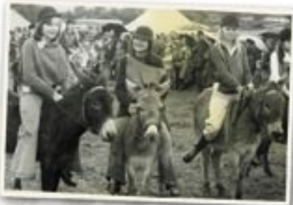
The Donkey Derby

diwedd Rhyfel Byd II, y Coroni, a Jiwbil'r Frenhines; i ddathliadau mwy lleol fel agor y meysydd chwarae, yr ysgol newydd neu neuadd y pentref.