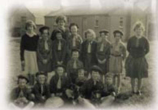
Brownies y Waun, 1963