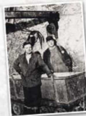
Mwynwyr yn Nhwnnel y Milwr

Noder – Mae'r rhan fwyaf o'r siafftau wedi cael eu llenwi neu eu cau, ond mae rhai yn dal yn dyllau gyda ffens o'u cwmpas. Dylid cymryd gofal mawr wrth y safleoedd hyn am eu bod yn gallu bod yn ansad dros ben.