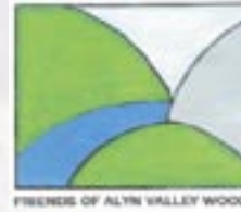
FIBRES OF ALYN VALLEY WOODS

Yn yr haf, mae'r llennyrc'h yn y coed yn lleoedd da i weld gloÿnnod byw fel brych y coed.