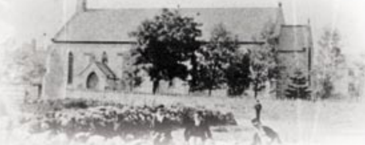
Eglwys y Drindod Sanctaidd gyntaf, y Waun