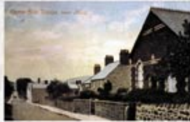
Capel y Waun

Roedd perchnogion Rhual ar ddiwedd y 17eg yn Fedyddwyr selog a bu pregethwyr teithiol yn derbyn croeso yma'n rheolaidd. Hwyl a adeiladodd fedyddfa Rhual, sy'n cael ei llenwi â dŵr ffynnon naturiol, i gynnal gwasanaeth bedyddio drwy drochi. Caiff y fedyddfa ei defnyddio ambell waith; bu dau wasanaeth bedyddio yn ystod y blynyddoedd diweddar.