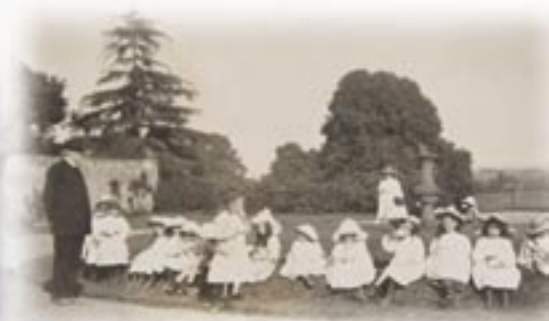
Ymweliad yr Ysgol Sul â Rhual, tua 1900