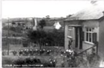
Gynt yn Pensarn Stores, Pantymwyn

Roedd y pentrefi yn fwy hunangynhaliol o lawer na heddiw, ac roedd siopau ymhob un oedd yn gallu ateb pob galw. Nid ar chwarae bach nag ar frys yr aed i brynu yn y siop, byddai'n gyfle i gyfarfod â ffrindiau ac yn achlysur cymdeithasol i gyfnewid newyddion y pentref.