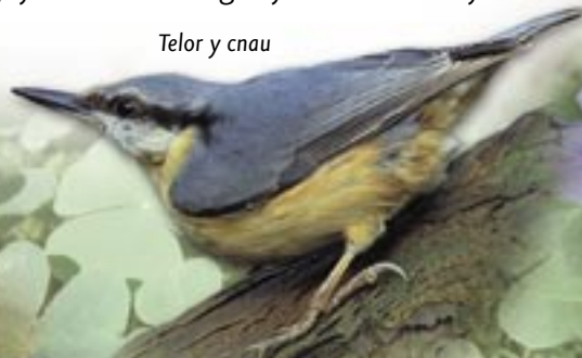
Telor y cnau

Yn yr haf, mae'r llennyrc'h yn y coed yn lleoedd da i weld gloÿnnod byw fel brych y coed.