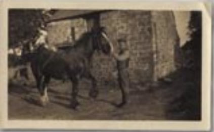
Ffordd Hir, y Waun