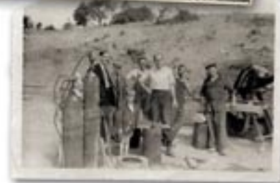
Chwarel Sbar Pensarn tua 1920au