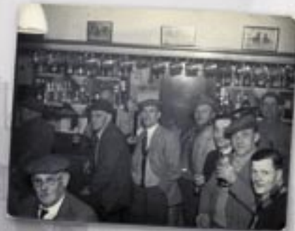
Y tu mewn i Dafarn y Crown newydd

Roedd dwy dafarn yng Ngwernaffield tan yn ddiweddar. Yr Hand ar y groesffordd a'r Miners Arms i lawr y ffordd. Yn ôl y