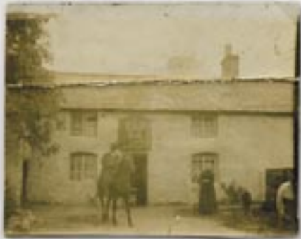
Y tu allan i hen Dafarn y Crown

Y dafarn oedd un o ganolfannau'r pentref. Doedd fawr o elw yn dod ohoni ac felly'r gwragedd oedd yn rhedeg y dafarn a'r dynion yn gweithio fel ffermwyr neu fwynwyr i gael dau ben llinyn ynghyd.