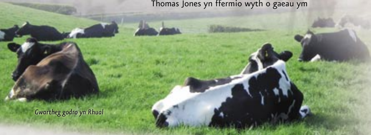
Gwartheg godro yn Rhual