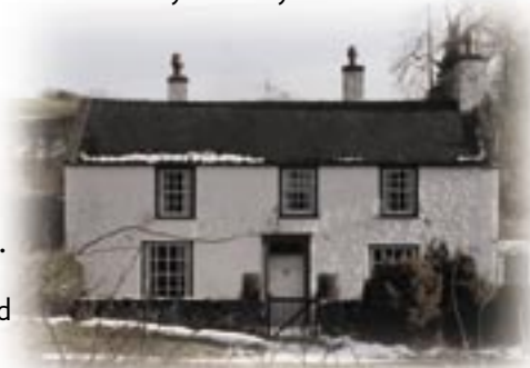
Pen-y-ffron, hen dŷ capten y mwynglawdd

Rhwng 1823 a 1845 bu'r peiriannydd enwog John Taylor, a adeiladodd Plas Coed Du yn gweithio nifer o'r mwyngloddiau lleol a elwir yn 'the Mold Mines'. Buddsoddodd lawer