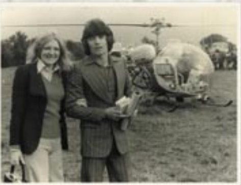
Kevin Keegan yn cyrraedd i agor y ffair