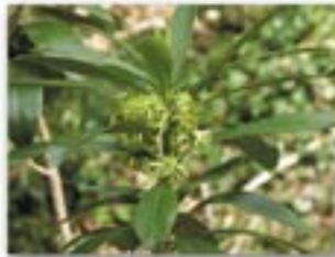
Clust yr ewig

Mae'r goedwig yn gynefin i nifer fawr o adar ac anifeiliaid. Nytha'r adar, a bydd ystlumod yn clwydo mewn tyllau a chafnau mewn hen goed. Mae infertebratau, gan gynnwys chwilod, larfae, nadroedd miltroed a moch coed, yn byw mewn coed marw a dail ar lawr. Yn eu tro mae'r rhain yn fwyd i adar fel cnocell y coed a thelor y cnau. Bydd y mamaliaid fel llygod, llygod y dŵr, moch daear, a llwynogod, yn elwa o'r bwyd a'r cysgod yn y goedlan. Mae llawer o ffwng yn byw ar goed marw ac yn ailgylchu'r maetholion yn ôl i bridd y goedlan.