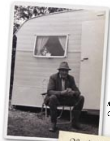
Mr Rich ym Mharc Carafannau Coed Mawr

Rhoddodd nifer o ffermwyr ganiatâd i ymwelwyr wersylla yn eu caeau, ac yn y 1930au adeiladwyd clwstwr o gytiau gwyliau ar Fferm Coed Mawr, Pantymwyn. Yn raddol, daeth carafannau yn eu lle, ac ymhen amser datblygodd i fod y parc carafannau sydd yma heddiw. O Lannau Merswy y daw'r mwyafrif o berchnogion y carafannau a nifer o genedlaethau o'r un teulu yn dod yn ôl flwyddyn ar ôl blwyddyn. Codwyd hen gerbydau rheilffordd a chytiau pren yn anffurfiol yng nghoed Cefn Bychan hefyd.