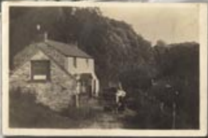
Caffi Tan-y-graig ar lwybr y Lît