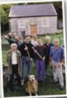
Y tîm fu'n adnewyddu capel Pen-y-fron