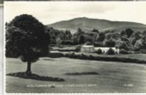
Golygfa Moel Famau o'r Cwrs Golff

Mae'r sioeau a'r carnifalau wedi newid yn nhreigl amser. Nid oes unrhyw orymdeithio ar y briffordd oherwydd y traffig cyfoes, ond mae'r ysbryd cymunedol yn dal mor gryf ag erioed, a sioe a Gymkhana Pantymwyn mor boblogaidd ag erioed ym mis Awst.