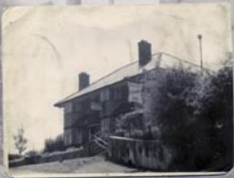
Crown Inn newydd

sôn, roedd y chwarelwyr a'r mwynwyr yn torri'u syched yn y Miners Arms, oedd yn wreiddiol yn dŷ talu'r cloddfeydd lleol, a'r Hand oedd tafarn y gweision fferm. Byddai'r cwsmeriaid yn dod a'u jariau i'w llenwi â chwrw i'w yfed gartref.