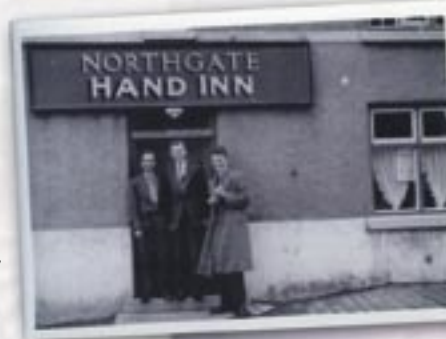
Y tu allan i'r Hand 1957

Ar ôl cau chwarel Cae Rhug aeth nifer y cwsmeriaid i lawr ac nid oedd modd cynnal dwy dafarn. Caeodd y Miners yn 2007 ac mae'n dŷ preifat erbyn hyn, ond mae'r Hand yn dal yn dafarn groesawgar (ffoniwch 01352 740581 am oriau agor)