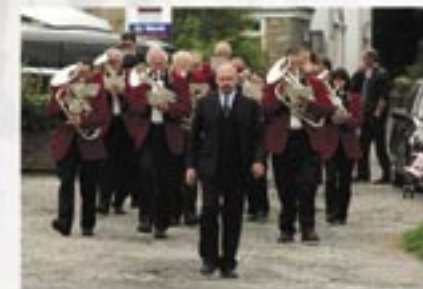
Band Arian yn gorymdeithio, Gorffennaf 2009