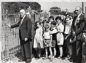
Agoriad Swyddogol Meysydd Chwarae y Waun

ac yn ddiweddarach rhoesant arian i ffurfio grŵp chwarae.