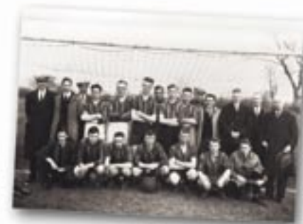
Tîm Pêl-droed y Waun, 1930au neu 40au.