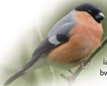
Coch y berllan

Caiff pryfed amrywiol gysgod a bwyd yn y blodau a'r glaswellt toreithiog, mae yma neithior i'r gloynnod byw a dail i'r lindys. Cofnodwyd ugain o loynnod byw gwahanol yma. Mae'r gwrmyd y ddol a'r porthor yn gyffredin