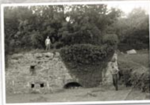
Yr Odyn Calch cyn adeiladu Kiln Lodge.

Roedd haenau o galchfaen a thanwydd - golosg yn y dechrau ac wedyn glo o ansawdd isel - yn cael eu bwydo i'r odyn o'r tu uchaf i wely o brysgwydd. Byddai'n cael ei gynnu o'r ochr isaf drwy dyllau cynnau. Ar ôl y llosgi, byddai'r calch a'r lludw yn cael ei dynnu o'r grât drwy dwnnel bwa oedd ar ochr yr odyn.