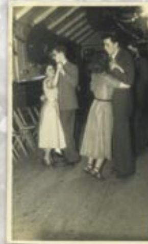
Dawns Ysgol Ramadeg yr Wyddgrug yn Neuadd Pentref Pantymwyn