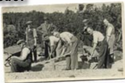
Gwirfoddolwyr yn cloddio sylfeini ar gyfer Neuadd Bentref Pantymwyn.

Ffurfiwyd Undeb y Mamau y Waun yn 1920, a ffurfiwyd Sefydliad y Merched (WI), yn 1952. Roedden nhw'n cyfarfod nid yn unig ar gyfer achlysuron cymdeithasol ond i wneud lles i'r gymuned hefyd. Darparodd y WI glinig bwyd babanod i famau ifanc