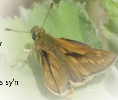
y gwibiwr mawr

Yn y dyffryn ceir nifer o adar ac anifeiliaid anghyffredin eraill. Daeth y dyfrgwn yn ôl i'r Afon Alun, bu hebogau tramor yn magu cywion yn y chwarieli lleol a'r ystumod bedol leiaf yn byw mewn ogofeydd a thwneli'r mwyngloddiau yn Nyffryn yr Afon Alun.