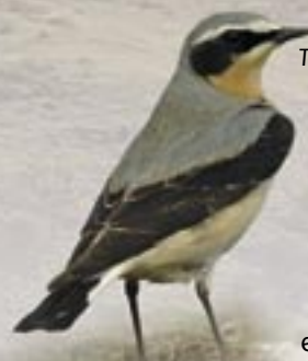
Tinwen y garn