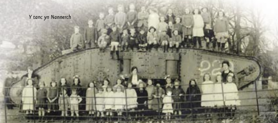
Y tanc yn Nannerch

Y peth mwyaf anghyffredin a roddodd y teulu Buddicom i'r pentref oedd tanc o'r Rhyfel Byd Cyntaf oedd wedi cael ei gynllunio'n rhannol gan yr Uwchgaptan Harry Buddicom. Ar ôl y rhyfel, cafodd ei gludo mewn trê'n a'i yrru i ganol y pentref ble roedd tyrfa o blant cyffrous yn ei groesawu. Safodd gyferbyn â'r Swyddfa Bost tan 1938, ac yna cafodd ei dorri'n ddarnau i'w aildefnyddio yn yr Ail Ryfel Byd.