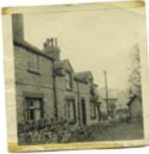
Yr Ysgol Gyntaf