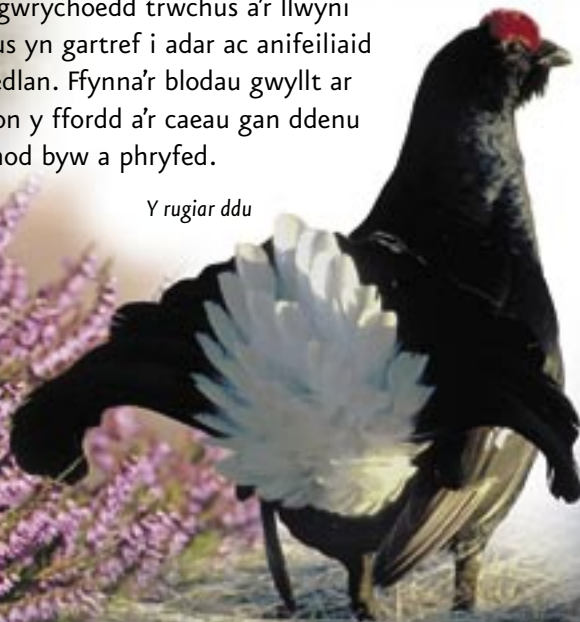
Y rugiar ddu

Mae'r gwrychoedd trwchus a'r llwyni niferus yn gartref i adar ac anifeiliaid y goedlan. Ffynna'r blodau gwyllt ar ymylon y ffordd a'r caeau gan ddenu gloynnod byw a phryfed.