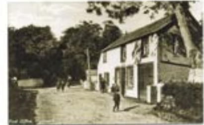
Yr Hen Swyddfa Bost