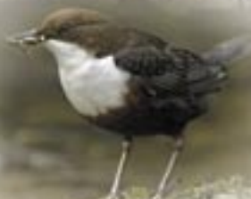
Bronwen y dwr

Ar y tir uwch ceir cymysgedd o laswelltir gwyllt a rhostiroedd grug, sy'n gynefin brin yn fyd-eang. Ym mis Gorffennaf, gwelir ffrwythau toreithiog y llus, ac yn Awst try'r bryniau'n lliw porffor godidog pan fo'r grug yn ei flodau. Tyfa'r blodau gwyllt yn frith ar y glaswelltiroedd gan gynnwys teim gwyllt, y blodyn bach melyn hwnnw tresgl y moch, a'r blodyn bach eiddil llysiâu Crist sy'n amrywio o las golau i las tywyll.