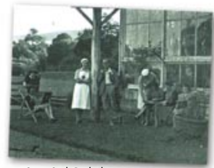
Croes Goch Penbedw